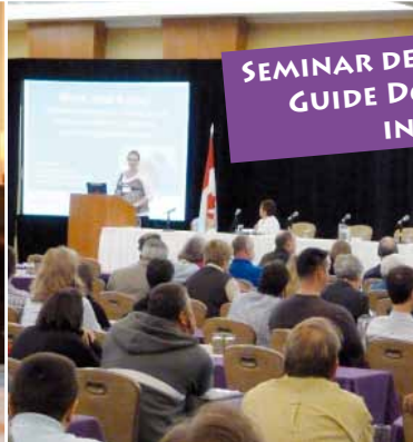
SEMINAR DER INTERNATIONAL GUIDE DOG FEDERATION IN KANADA