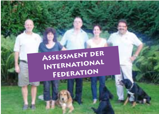
ASSESSMENT DER INTERNATIONAL FEDERATION