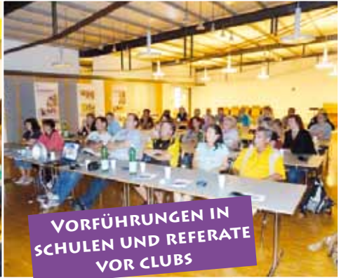
VORFÜHRUNGEN IN SCHULEN UND REFERATE VOR CLUBS