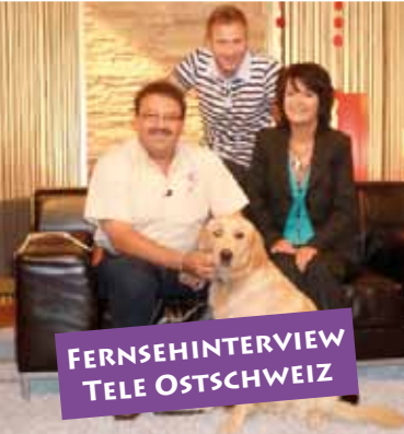
FERNSEHINTERVIEW TELE OSTSCHWEIZ